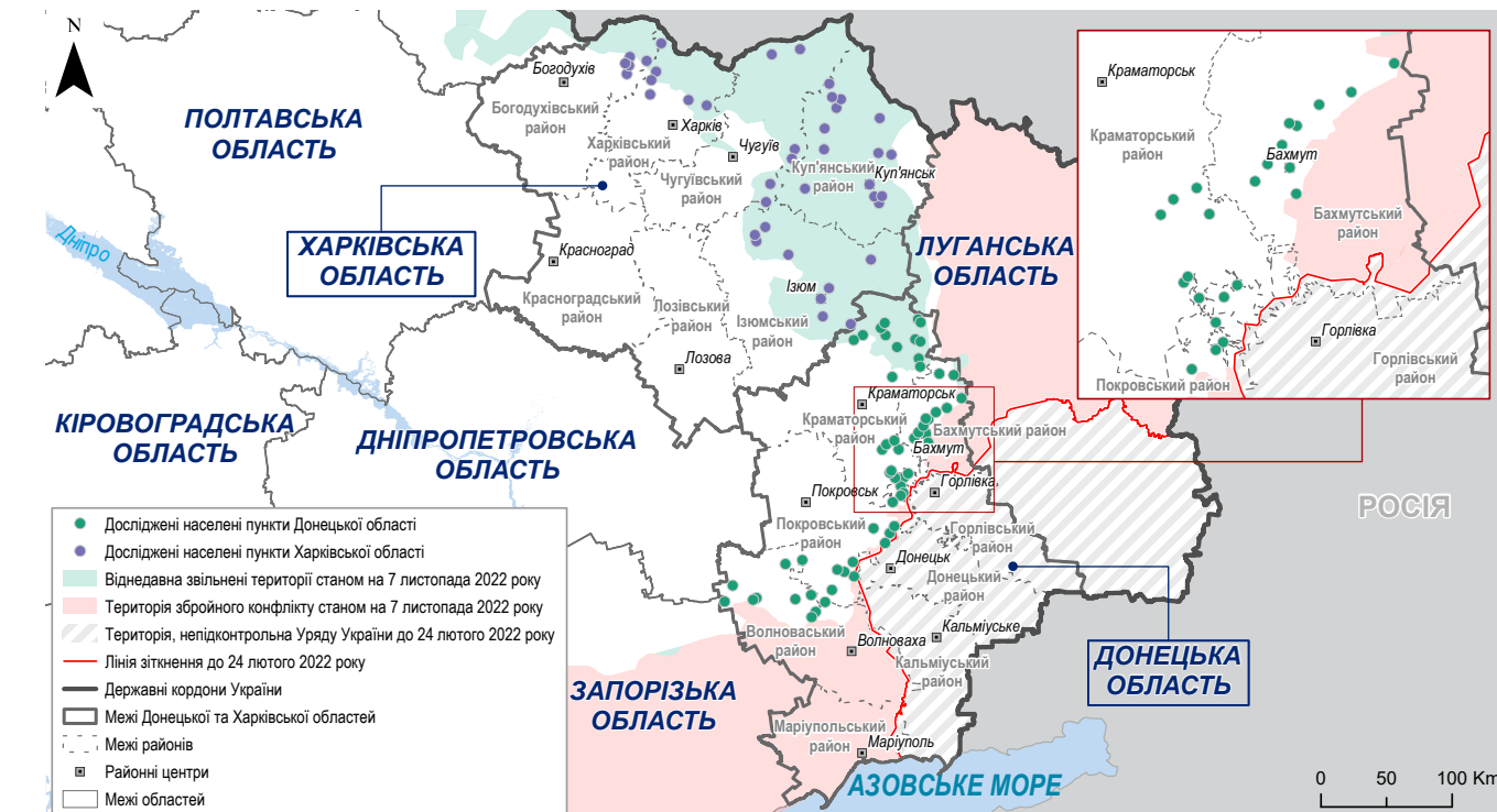
Карта 1. Географічне охоплення дослідження у цільових районах Харківської та Донецької областей

Крім того, враховуючи, що КІ обиралися на основі їхньої відповідності критеріям відбору, мінімальна кількість КІ на населений пункт не встановлювалася. Тому висновки щодо окремих населених пунктів слід тлумачити з обережністю, оскільки вони є орієнтовними.