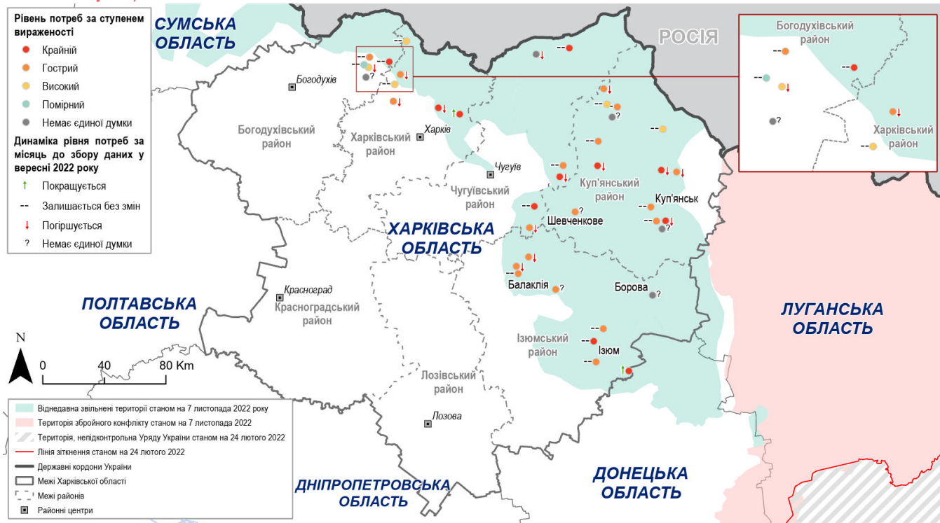
Карта 2. Загальна вираженість потреб та динаміка рівня потреб, про які повідомили КІ у населених пунктах у цільових районах Харківської області (n=40 населених пунктів)